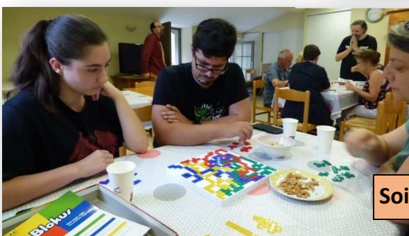
Soirée jeux de société