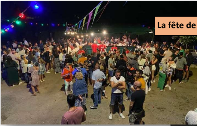
La fête de Générations Couffoulens