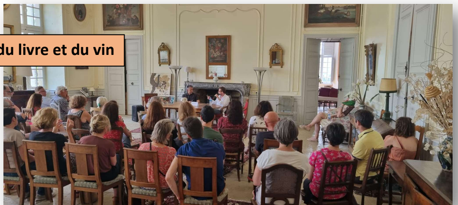
Festival du livre et du vin